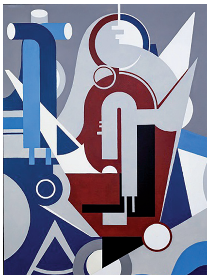
Le scaphandrier - 2020 - 80 x 120 cm