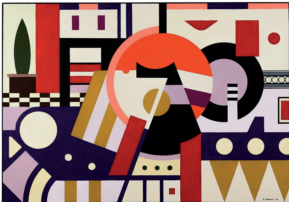
Le moulin à eau - 2020 - 70 x 100 cm

Ses grands tableaux réalisés à l'acrylique après un travail numérique représentent ces contrastes entre des formes rondes, douces et des lignes plus sévères qui rappellent les contrastes de l'être humain, ses contradictions.